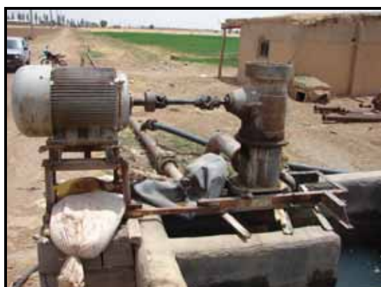
شکل ۲- ایستگاه پمپاژ سیستم آبیاری بارانی

پمپاژ با موتورهای دیزلی ۱۲/۷ درصد (۵۲/۹ درصد معیار نبراسکا) به دست آمد که از آن مقدار که فیپز و نیل (Fippes & Neal, 1995) به دست آوردند (۱۸/۱ درصد) کمتر است. با تلفیق مزارع دارای ایستگاه پمپاژ دیزلی و برقی فقط ۱ مورد از ۱۷ مزرعه بررسی شده بازده (یعنی در ۵/۹ درصد مزارع) مجموع انرژی بالاتر از معیار پمپاژ نبراسکا است. در حالی که آزمایش‌های راجرز و عالم (Rogers & Alam, 1999) در ایالت نبراسکا نشان داد ۱۵ درصد ایستگاه‌های پمپاژ بالای معیار نبراسکا عمل می‌کنند. میانگین بازده موتورهای الکتریکی در استان همدان ۹۲/۴ درصد، از معیار پمپاژ نبراسکا بالاتر است.