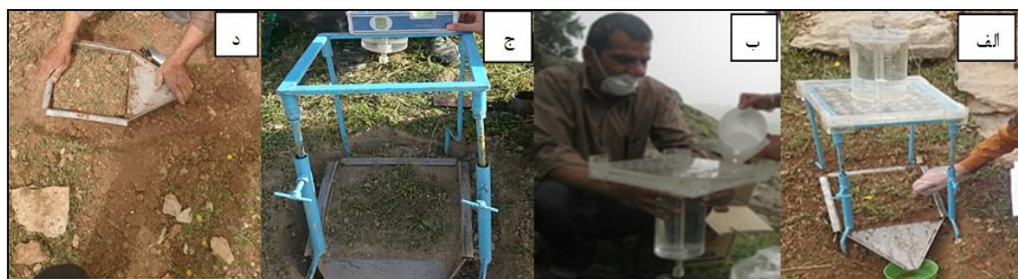
شکل ۲- الف) نحوه نمونه‌برداری، ب) پر کردن مخزن، ج) تراز کردن دستگاه، د) پلات دستگاه بارانساز

به‌منظور کاهش متغیرهای موجود (۱۵ متغیر مؤثر در فرایند فرسایش و تولید رسوب) در حوزه آبخیز سیدآباد، از روش تجزیه و تحلیل عاملی استفاده شد و تأثیرگذارترین متغیرها به‌ترتیب اولویت بر میزان فرسایش و رسوب مشخص شد (Zare Chahuki, ۲۰۱۱). در این روش، نخست برای پرهیز از تأثیر واحدهای اندازه‌گیری، متغیرهای مورد استفاده استاندارد شدند.