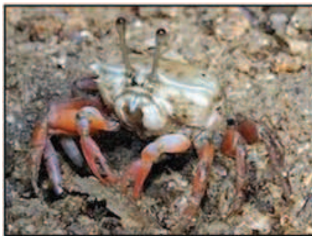
شکل ۳- جنس نر خرچنگ ویولن‌زن (بالا) و جنس ماده خرچنگ ویولن‌زن (پایین)

با توجه به اینکه خوراک آبزیان پرورشی به‌عنوان منبع غذایی مناسبی برای بی‌مهرگان کف‌زی به‌ویژه خرچنگ‌های ویولن‌زن یا نقب‌زن در مزارع پرورش میگو و یا کانال‌های مجاور آن‌ها بشمار می‌رود، حضور آن‌ها در مزارع پرورشی اجتناب‌ناپذیر است. وجود خرچنگ‌ها در مزارع پرورش میگو همواره به‌عنوان ناقلین بالقوه بیماری‌های میگو به‌ویژه بیماری سندروم ویروسی لکه سفید بشمار می‌روند. مطالعات صورت گرفته بر میزان تأثیرگذاری حضور خرچنگ‌های حامل عامل بیماری‌زا گونه‌های خرچنگ ویولن‌زن Uca Sesarma و Scylla serrata نشان داده است که این خرچنگ‌ها در مزارع