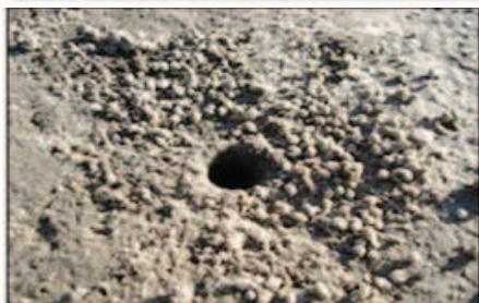
شکل ۵- نمایی از جنس نر Uca sindensiss در کانال زهکش و نمایی از حفر دالان در دیواره استخر پرورش میگو