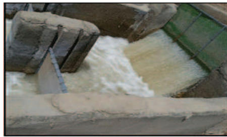
شکل ۷- نصب فیلتر در مسیر آبیگری منتهی به استخر پرورشی.

نصب فیلترهای توری مناسب با اندازه چشمه های متفاوت در مسیر ورودی آب نیز در کنترل این موجودات ناخواسته بسیار حائز اهمیت است و هرچه تعداد فیلترهای تعبیه شده در مسیر آبیگری منتهی به استخر افزایش یابد احتمال ورود خرچنگ های مزاحم به استخرهای پرورش میگو نیز کاهش خواهد یافت.