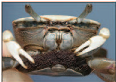
شکل ۱- جنس ماده خرچنگ ویولن زن پس از جفت گیری و نمایی از تخم خرچنگ ویولن زن که در زیر شکم ماده حمل می گردد