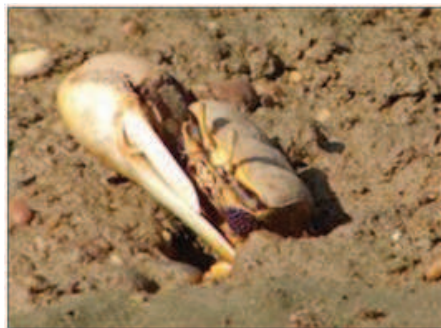
شکل ۴- نمایی از جنس نر Uca sindensiss