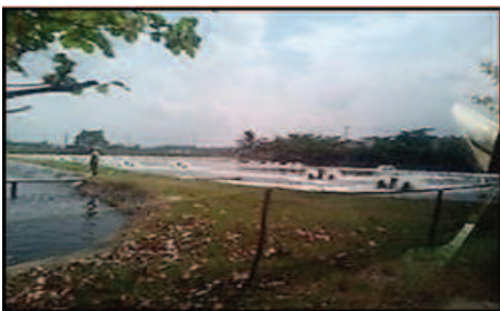
شکل ۶- نمایی از نصب توری خرچنگ گیر در اطراف مزارع پرورش میگو

ویروس عامل بیماری لکه سفید قادر است ۵ تا ۷ روز در آب زنده مانده و بیماری‌زایی خود را حفظ نماید. بنابراین یکی از راه‌های انتقال بیماری به مراکز تکثیر و مزارع پرورشی، آب ورودی به آنها است. آب ورودی علاوه بر اینکه ممکن است حامل ویروس آزاد باشد، می‌تواند حامل تعداد زیادی از حاملین ویروس مثل پلانکتون‌ها، لارو آبزیان اعم از ماهی و میگو وحشی و سایر جانداران دیگر نیز باشد. بنابراین بهتر است آب قبل از استفاده در مزارع و مراکز تکثیر ضدعفونی شده و سپس استفاده گردد (OIE, 2006). به‌منظور جلوگیری از ورود این موجودات ناخواسته به داخل استخر می‌توان استخرها را مجهز به توری‌های خرچنگ گیر (Crab fence) به‌ویژه در دیواره استخرها و دریچه‌های خروجی نمود.