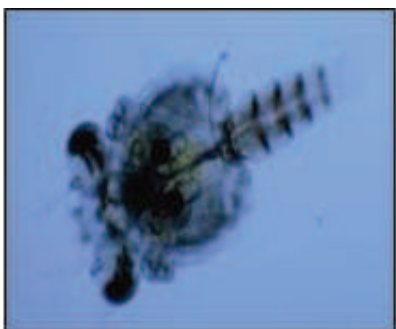
شکل ۲- نمای مرحله زوا و نمای مرحله مگالوپ

حضور خرچنگ ها به عنوان ناقلین بالقوه عامل بیماری، موجب گسترش بسیاری از بیماریهای ویروسی، به ویژه بیماری ویروسی لکه سفید در مزارع پرورش میگو می شود.