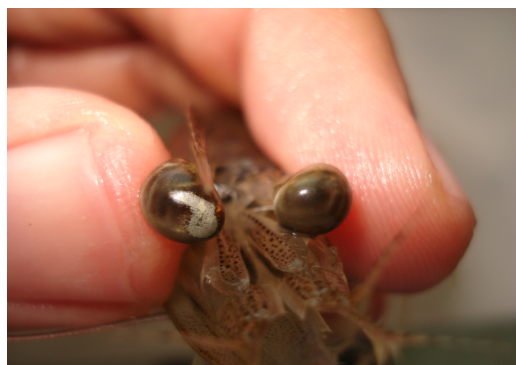
شکل ۱: حضور لکه‌های سفید در چشم میگو

مختلف نمونه‌برداری صورت گرفته به آزمایشگاه ارسال شد در کل ۲۰ نمونه میگوی زنده جهت آزمایشات باکتری شناسی، ۶ میگوی کامل ثابت شده جهت آزمایشات بافتی، ۳۵ نمونه پای شنا جهت انجام آزمایشات واکنش زنجیره ای پلی‌مرز اخذ و به آزمایشگاه ارسال شد. به منظور انجام آزمایشات واکنش زنجیره‌ای پلی‌مرز (PCR) یک عدد از پای شنای میگوها کنده و درون یک لوله ۱/۵ میلی‌لیتری قرار داده شده و بلافاصله در کنار