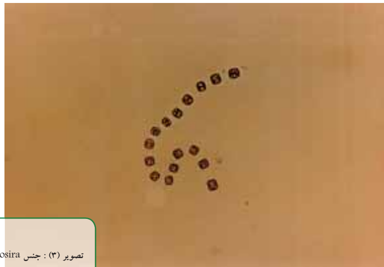
تصویر (۳): جنس Thalassiosira از جلبکهای میکروسکوپی (obj. ۴۰x)

در انجام این تحقیق لازم می دانم از کلیه همکاران در بخش آبی