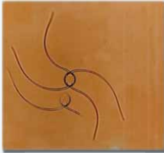
تصویر (۵) : جنس Chaetoceros از جلبکهای میکروسکوپی (Obj. ۴۰x)