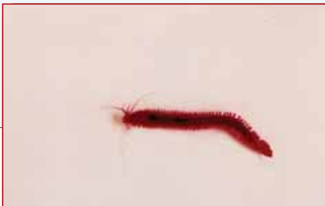
تصویر (۷) : گروهی از کرمها شامل جنس Nereis که به صورت چراکننده در لابلای تالهای جلبک گراسیلاریا وجود داشت (Obj. 10x)

7. Doty M.S, 1980. Outplanting euechurma species and Gracilaria species in the tropics. California Sea Grant College Programe. Lajolla : 19-22.