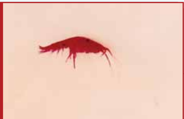
تصویر (۶) : گروهی از چراکنندگان شامل ایزوپودآ که در لابلای جلبکهای گراسیلاریا پرورشی وجودداشت (Obj.10x).