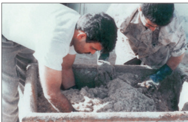
عکس شماره ۳

تحقیقات دامپروری دزفول تعداد ۸ رأس گاو میش که ۶ هفته از زایمان آنها گذشته بود انتخاب شدند و در قالب طرح مربع لاتین با تکرار مربعات در دو مربع ۴×۴ تحت آزمایش قرار گرفتند. ردیف‌های مربع شامل دوره‌های ۲۸ روزه اجرای آزمایش و ستون‌ها شامل شکم‌های مختلف زایش بودند. ۱۴ روز اول هر دوره آزمایش به‌عنوان دوره عادت پذیری به جیره غذایی جدید و ۱۴ روز دوم به‌عنوان دوره اصلی آزمایش در نظر گرفته شد. تیمارها (جیره‌های غذایی) شامل: (۱) جیره غذایی