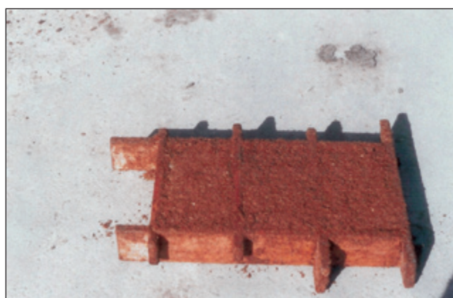
عکس شماره ۲