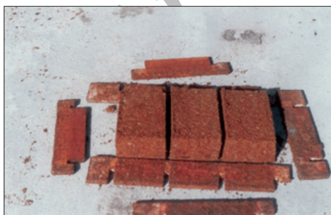
عکس شماره ۴