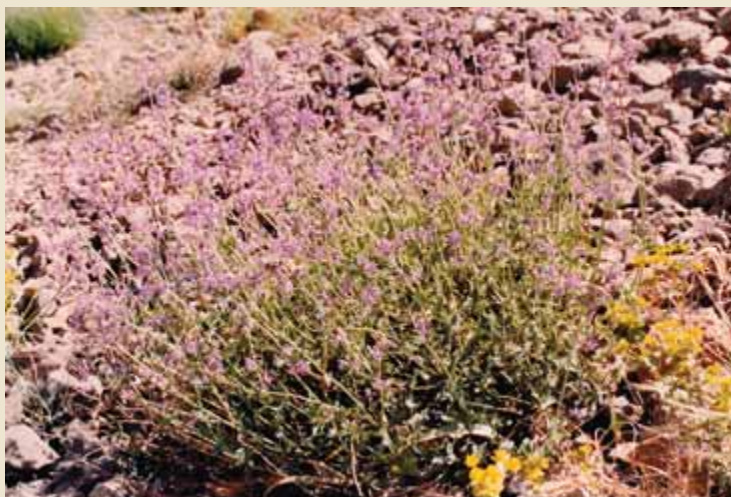
عکس شماره (۴) - پونه‌سای انبوه بمویی Nepeta glomerulosa از گیاهان شهدزا در منطقه شمال دماوند

بیشترین گیاهان مورد استفاده زنبور عسل دارای جذابیت خوب هستند و بعد از آن به ترتیب گیاهان با جذابیت عالی و متوسط قرار دارند (۱). بر اساس مطالعات Verma در مناطق مجاور کوه‌های کاتماندو در نپال بیشترین گیاهان مورد استفاده زنبور عسل دارای جذابیت متوسط هستند و بعد از آن به ترتیب گیاهان با جذابیت ضعیف و جذابیت زیاد برای زنبور عسل قرار دارند (۸). Maskey با مطالعات خود در کاتماندو گیاهان را از نظر جذابیت برای زنبور عسل به دو دسته تقسیم نمود که بیشترین گیاهان دارای جذابیت زیاد و بعد از آن گیاهان با جذابیت ضعیف برای زنبور عسل هستند (۵). بر اساس تحقیقات انجام شده در مناطق مختلف به نظر می‌رسد درصد گیاهان با جذابیت زیاد بیش از درصد گیاهانی است که دارای جذابیت کمتری برای مجموعه مطالعات انجام شده در منطقه شمال دماوند گامی است برای دستیابی به اهداف بعدی که تهیه تقویم زنبورداری و همچنین تعیین پتانسیل زنبورپذیری این منطقه می‌باشد.