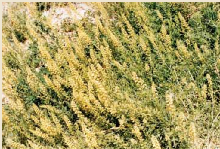
عکس شماره (۳) - ورت Reseda lutea از گیاهان جذاب و گرده‌زا برای زنبور عسل در منطقه شمال دماوند