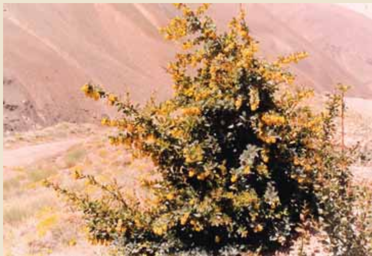
عکس شماره (۱) - زرشک زرافشانی Berberis integerrima از گیاهان شهدزا و گرده‌زا در منطقه شمال دماوند

نتایج این پژوهش در منطقه شمال دماوند نشان می‌دهد که از نظر جذابیت گیاهان برای زنبور عسل تعداد ۹ گونه (۶/۵٪ گونه‌ها) در کلاس I و دارای جذابیت عالی هستند، ۲۱ گونه (۱۵/۱٪ گونه‌ها) در کلاس II (خوب)، ۸۶ گونه (۶۱/۹٪ گونه‌ها) در کلاس III (متوسط) و ۲۳ گونه (۱۶/۵٪ گونه‌ها) در کلاس IV ضعیف قرار دارند. براساس مطالعات نظریان و همکاران در استان تهران بیشترین گیاهان مورد استفاده زنبور عسل دارای جذابیت خوب هستند و بعد از آن به ترتیب گیاهان با جذابیت متوسط، عالی و ضعیف قرار دارند (۴). طبق بررسی‌های اسدی و همکاران. در استان مرکزی