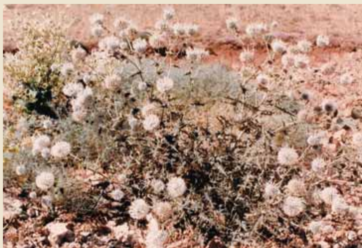
عکس شماره (۲) - شکر تیغال بومهنی Echinops leiopolyceras از گیاهان شهدزا و گرده‌زا در منطقه شمال دماوند

مشابه انجام شده در ایران و بعضی تحقیقات انجام شده در مناطق دیگر جهان مطابقت دارد.