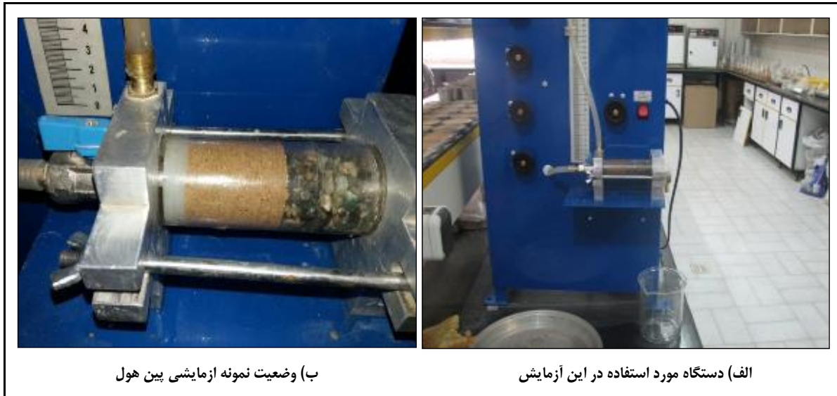
ب) وضعیت نمونه آزمایشی بین هول