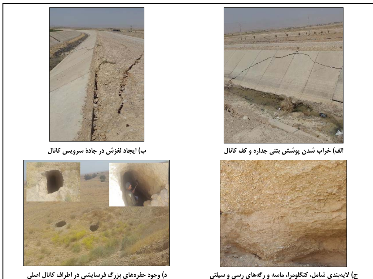
شکل ۲- لایه‌بندی خاک منطقه و خرابی‌ها در پوشش کانال