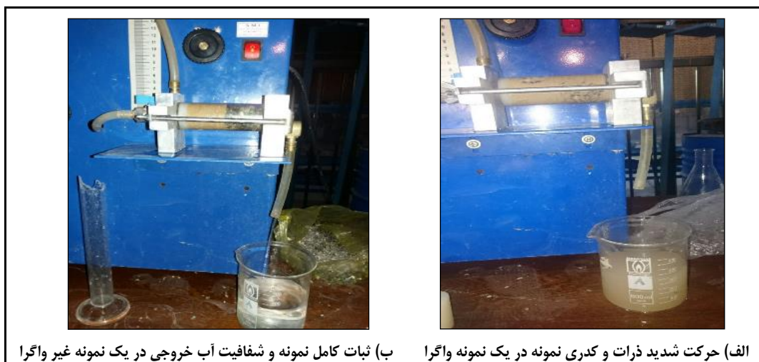
شکل ۶- مراحل مختلف آزمایش بین‌هول