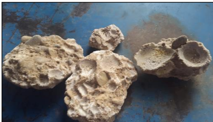
شکل ۴- توده های بلورین گچی در خاک خارج شده از بستر کانال در کیلومتر ۴۰۰+۲۴

حاصل از بازدیدهای میدانی، مشکل‌آفرین بودن خاک بستر محرز تشخیص داده شد. بدین معنی که خرابی‌ها به‌واسطه