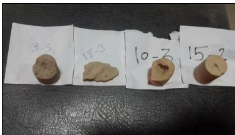
شکل ۷- وضعیت نمونه‌های آزمایشی پس از آزمایش بین‌هول

تمهیدات لازم برای کنترل خطر گچ، از جمله آب‌بندی کانال و جلوگیری از ورود آب به پشت پوشش، خطر واگرایی نیز کنترل خواهد شد.