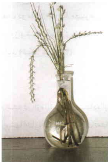
شکل شماره ۱: انجام تلاقیهای بین گونه‌ای در شرایط آزمایشگاهی در شرایطی که ساقه‌های حامل گل پایه‌های مادری پای در آب نگهداری می‌شدند.