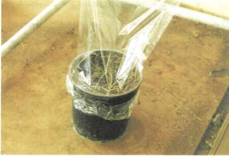
شکل شماره ۳: انتقال گیاهان به گلدان و انجام عمل سازگاری با شرایط محیطی