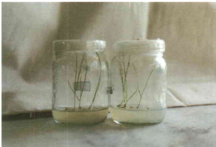
شکل شماره ۲: کشت بذرهای نارس در محیط کشت MS و تولید گیاه کامل.