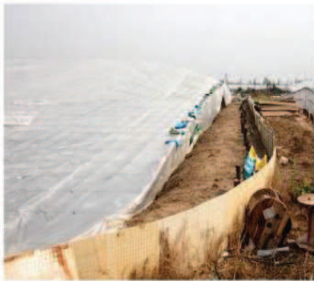
شکل ۲- استفاده از فنس و توری برای کنترل ورود خرچنگ و پرند به استخر

(شکل‌های ۲ و ۳) (دشتیان نسب، ۱۳۹۶) و برای رسیدن به حداکثر ظرفیت نگهداری میگو در استخر، اجرای سیستم خروجی مرکزی الزامی است.