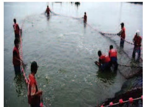
شکل ۴- صید اضطراری میگوهای آلوده بدون رهاسازی آب استخر به‌منظور رعایت ایمنی زیستی.

توان با رعایت اصول ایمنی زیستی میگوها را بدون تخلیه آب صید کرد (شکل ۵) و پس از صید میگوهای آلوده (با رعایت کامل اصول بهداشتی) و پس از ضدعفونی آب مثل مورد قبل، می‌توان اقدام به تخلیه آب استخر نمود. هیچ وقت به خاطر جواب آزمایش PCR وقت را از دست ندهید، طی دوره قرنطینه رفت‌وآمد همه افراد شامل کارگر، مدیر، دامپزشک و سایر بازدیدکنندگان به استخر مذکور بایستی تحت کنترل سخت‌گیرانه باشد. همه نوع نمونه‌گیری از میگو یا آب و خاک بایستی معلق شود تا آلودگی به سایر استخرها منتقل نشود. یک تیم مخصوص لازم است که پروتکل قرنطینه را به‌خوبی اجرا کند. هشدارهای ایمنی زیستی برای مزارع اطراف نیز الزامی است. به دلیل اینکه در هنگام بروز بیماری آموزش بسیار دیر است، لذا لازم است که در اول دوره کلیه آموزش‌های لازم به کارکنان شاغل در مزرعه و در محل سایت یا مزرعه اجرا شده باشد.