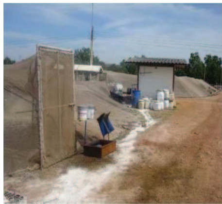
شکل ۳- استفاده از در ورودی و مواد شیمیایی حذف ویروس در بدو ورود به استخر به منظور رعایت ایمنی زیستی

زمانی که بیماری ویروسی در مزرعه بروز کرد، اجرای پروتکل سختگیرانه قرنطینه به منظور پیشگیری از انتشار و آسیب بیشتر ضروری است. استخر مشکوک بایستی هرچه سریع تر قرنطینه شده (شکل ۴) و از ورود افراد غیر ضروری به منطقه قرنطینه جلوگیری شود. همچنین مطمئن شوید که تمامی دریچه های ورودی و خروجی استخر مذکور بسته باشند.