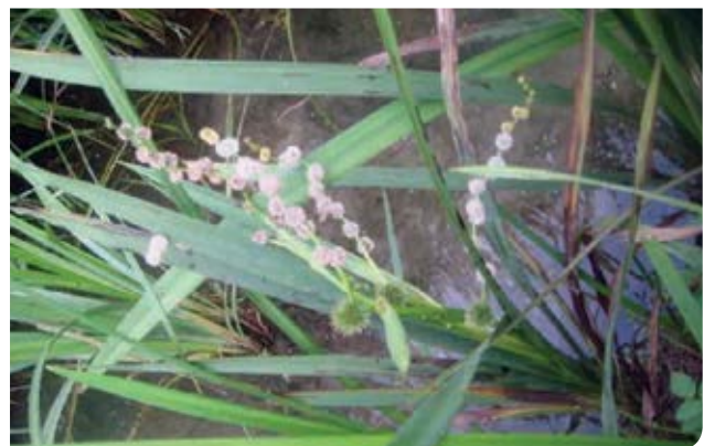
شکل ۴- نیلوفرهای محاصره شده توسط گیاهان مهاجمی مثل گونه‌های Phragmites australis (نی)، Sparganium erectum (نی تویی) و Sorghum halepense (چاییر)