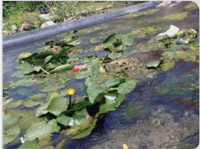
شکل ۵-۱- وضعیت رویشگاهی نیلوفر در سال ۱۳۸۵