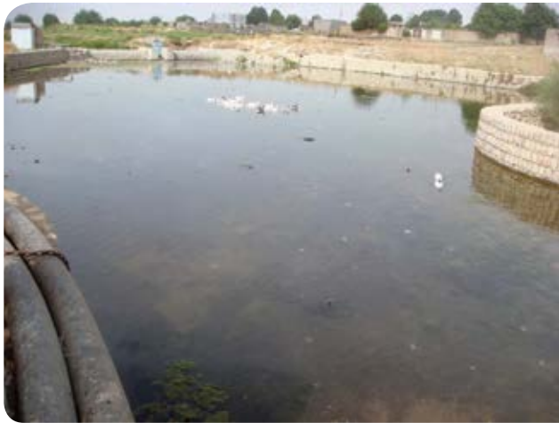
شکل ۵-۲- وضعیت رویشگاهی نیلوفر در سال ۱۳۹۵ و حذف پایه‌های نیلوفر