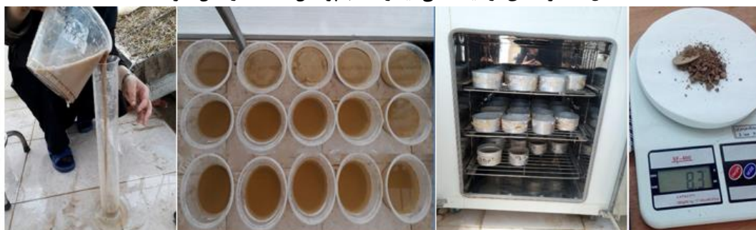
شکل ۳- مراحل برآورد روان آب و رسوب (مواد معلق).