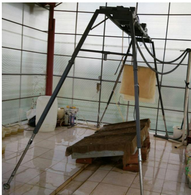
شکل ۱- شبیه‌ساز باران به کاررفته در این پژوهش.

شبیه‌ساز باران تشکیل شده از قسمت‌های مختلف سامانه‌ی آب‌رسانی، صفحه‌ی بارش، سامانه‌ی جمع‌آوری آب مازاد، و برد مهارکردنی است. صفحه‌ی بارش شامل دو افشانه‌ی نوسانی از نوع ویجت ۸۰۱۰۰ با قطر روزنه‌ی ۴/۵ میلی‌متر با قابلیت جابه‌جایی روی راه‌آه‌نی به طول دومتر است