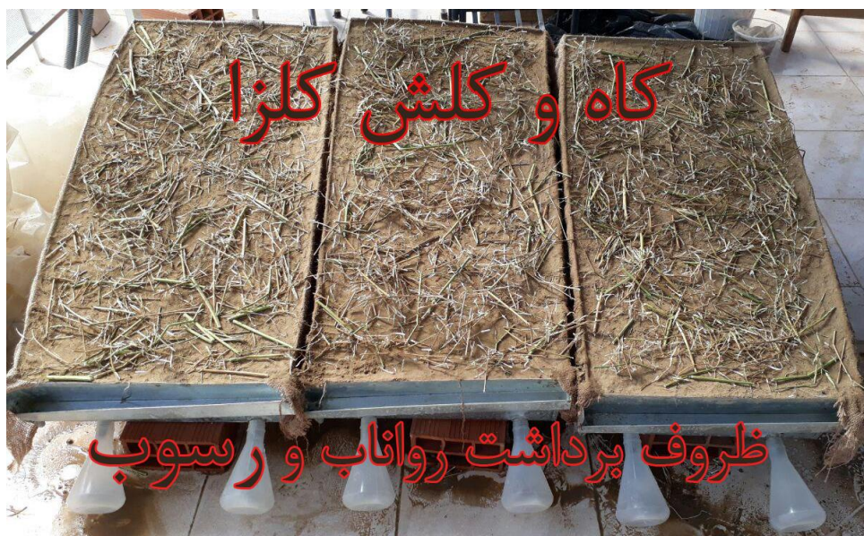
شکل ۲- کرت‌های آزمایشگاهی تیمار شده با پوشش ۲۵٪ کاه و گلش کلزا.

پس از تهیه‌ی خاک و کاه و گلش برای ایجاد شرایط معیار مشابه با طبیعت، و زهکشی بهتر (دفراشا و همکاران ۲۰۱۱) ۱۰ سانتی‌متر اول عمق کرت‌ها با پوک‌هی معدنی با لایه‌بندی متفاوت پر شد، و ۱۰ سانتی‌متر باقی‌مانده با خاکی با ترازهای رطوبت ۱۵، ۲۰ و یا ۳۰٪ پر شد. سطح خاک با غلطک به وزن مخصوص خاک (۱/۴۶ گرم بر سانتی‌متر مکعب خاک در شرایط طبیعی) رسانده شد (کاویان و همکاران ۲۰۱۵). برای مخلوط نشدن خاک با پوک‌هی معدنی و جابه‌جایی سریع خاک، در مراحل آزمایش یک لایه‌ی گونی کفنی بین پوک‌هی معدنی و خاک گذاشته شد. پس از واسنجی شبیه‌ساز باران، کرت‌های بی‌پوشش حفاظتی (شاهد) با خاک ۱۵٪ رطوبت، در بارش شبیه‌سازی شده‌ی ۵۰ میلی‌متر بر ساعت با تداوم بارشی ۱۰ دقیقه‌ی گذاشته، و روان آب و مواد معلق تولیدشده برداشت شد. مراحل آزمایش قبلی جداگانه برای خاک با رطوبت‌های ۲۰٪ و ۳۰٪ تکرار و نمونه‌های روان آب و مواد معلق تولیدشده‌ی این دو تراز رطوبتی خاک بی‌پوشش حفاظتی (شاهد) برداشت شد. در مرحله‌ی بعدی، آزمایش بر سطح خاک کرت‌های ۱۵٪ رطوبت و پوشانده‌شده‌ی یکنواخت با ۲۵٪ کاه و گلش کلزا (انصاری ۲۰۰۷) انجام، و روان آب و مواد معلق تولیدشده برداشت شد (شکل ۲). بعد از انجام آزمایش،