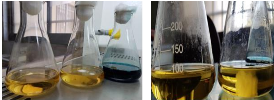
شکل ۳- نتایج کشت ۶ روزه در محیط GY براث. حضور و عدم حضور توده قارچی در محیط کشت دوزهای مختلف هواسان (راست) و مقایسه نمونه ها در دوزهای حاوی توده قارچی و فاقد آن با کنترل مثبت (مالاشیت گرین) (چپ)