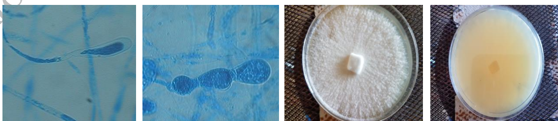
شکل ۱ - پشت و سطح پرگنه خالص ساپروولگنیا شکل ۲ - نمای میکروسکوپی زئواسپور و گاما قارچ ساپروولگنیا

۱ - جداسازی و شناسایی قارچ ساپروولگنیا: تخمهای قارچ زده قزل آلا با استفاده از پنس در ظروف درب دار حاوی آب مقطر استریل جمع آوری و به آزمایشگاه، ارسال گردید. در آزمایشگاه، پس از شستشو تخم با آب مقطر استریل، مدت ۲۴ ساعت در دمای ۱۸ - ۱۲ درجه سانتی گراد در ظروف حاوی آب مقطر استریل و آنتی بیوتیک (جهت ممانعت از رشد عوامل باکتریایی) گرمخانه گذاری گردید. پس از آن نمونه ها پس از شستشوی مجدد با آب مقطر استریل به صورت تلقیحی در پلیتهای حاوی Glucose Yeast extract chloramphenicol Agar (YGC) به صورت تلقیحی کشت داده و به مدت ۵ روز در دمای ۱۸ درجه سانتی گراد گرمخانه گذاری شدند (Ghiasi et al. , 2010). برای خالص سازی پرگنه از حاشیه پرگنه های رشد کرده با استفاده از اسکالپل استریل نمونه برداشته و مجدداً پاساژ داده شد و با تهیه لام میکروسکوپی و مشاهده ساختار میکروسکوپی هایف، اسپورانژیوم و گاما تولید شده و اطمینان از خلوص پرگنه کشت نهایی انجام و نمونه خالص تهیه گردید (Dayal, 2001) (شکل ۱ و ۲)