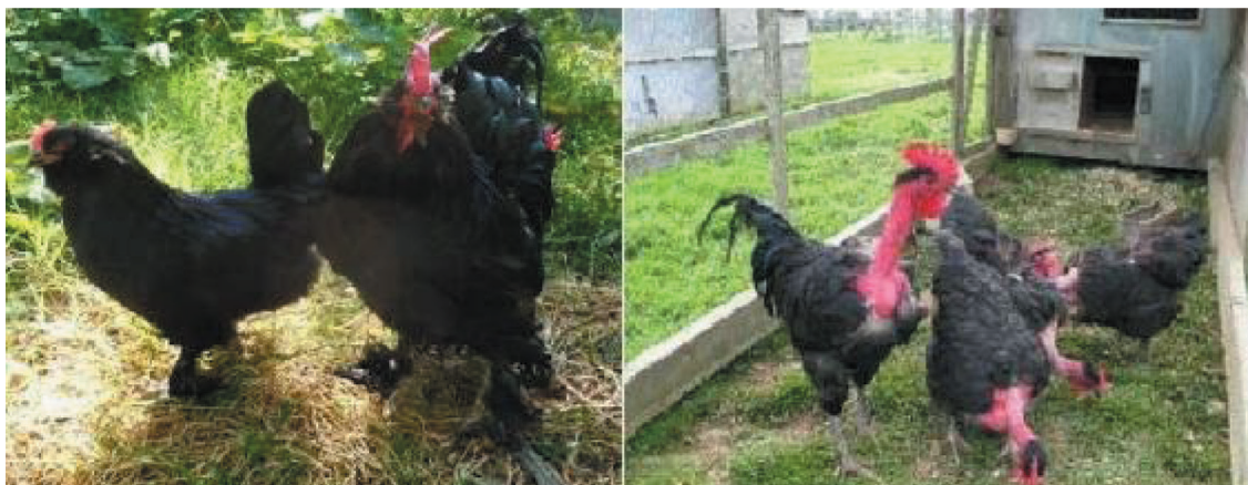
مرغ و خروس نژاد بومی مرندي