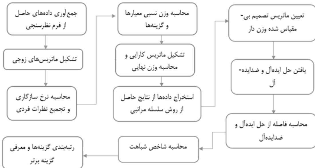
شکل ۲- فلوجارت تصمیم‌گیری چند معیاره تلفیقی در این پژوهش

- محاسبه فاصله از حل ایده‌آل و ضد ایده‌آل: برای