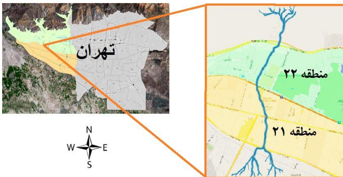
شکل ۱- تصویری از محل قرارگیری رودخانه وردآورد در شهر تهران

تصمیم‌گیری چند معیاره: تصمیم‌گیری مهمترین و حساس‌ترین بخش مدیریت و جوهره اصلی آن است. به دلیل متداول شدن بهره‌گیری از افراد با مشاغل، تخصص‌ها، تجربیات و سوابق مختلف در احیای رودخانه، ضرورت استفاده از روش‌های تصمیم‌گیری گروهی و چند معیاره بیش از پیش نمایان می‌شود. این روش تصمیم‌گیری در واقع در نظر گرفتن تمام معیارهای کمی، کیفی و حتی متناقض است. در حل این‌گونه مسائل باید به دنبال گزینه‌ای بود که بیشترین مزیت را برای تمامی معیارها ارائه می‌کند. روش‌های تصمیم‌گیری چند معیاره متعدد هستند و هر کدام از این روش‌ها خصوصیات، ضعف‌ها، قوت‌ها و شرایط کاربرد خاص خود را دارند. در این پژوهش، برای ارزیابی راهبردها و معیارها از ترکیب دو روش فرایند تحلیل سلسله مراتبی (AHP 1 ) و شباهت به گزینه ایده‌آل اصلاح شده (M-TOPSIS 2 ) که روش‌های مهم و کاربردی در تصمیم‌گیری چند معیاره می‌باشند، استفاده شده است. روش فرایند تحلیل سلسله مراتبی ابزاری قوی برای تصمیم‌گیری چند شاخصه در ارتباط با مسائل پیچیده است که در آن هر دو دیدگاه کیفی و کمی در نظر گرفته می‌شود (Ataei, 2009). روش شباهت به گزینه ایده‌آل نیز یکی دیگر از این روش‌هاست که محدودیتی برای تعداد معیارها نداشته،