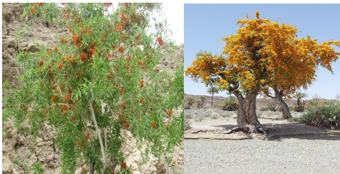
شکل ۲- نمایی از مورفوتیپ زرد (رویشگاه مغان شابو) و نارنجی (رویشگاه دامن) انار شیطان در منطقه بلوچستان