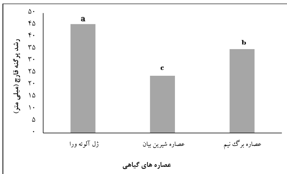
شکل ۲- اثر عصاره‌های گیاهی در رشد قارچ آسپرژیلوس نیجر

* اختلاف معنی‌دار در سطح احتمال ۵ درصد و ** اختلاف معنی‌دار در سطح احتمال ۱ درصد.