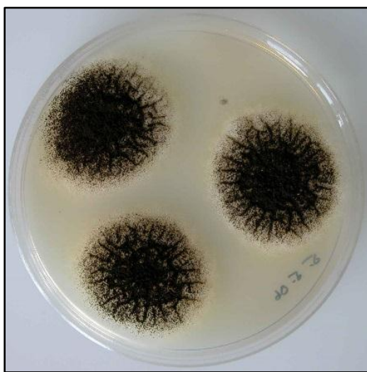
شکل ۱- قارچ آسپرژیلوس نیجر جدا شده از رطب مضافتی

در این پژوهش، میوه‌های خرمای مضافتی با نشانه‌های پوسیدگی از لحاظ آلودگی قارچی بررسی شدند تا بتوان قارچ غالب و عامل پوسیدگی را در آنها شناسایی کرد. گونه‌های قارچ رایزوپوس، پنی‌سیلیوم، فوزاریوم، آلترناریا و قارچ سیاه‌رنگ آسپرژیلوس متعلق به شاخه آسپرژیلوس نیجر از میوه‌های پوسیده خرمای مضافتی جداسازی شدند ولی گونه‌هایی از قارچ آسپرژیلوس سیاه‌رنگ متعلق به شاخه آسپرژیلوس نیجر در تمامی نمونه‌ها (رطب مضافتی) غالب بود (شکل ۱). پرگنه این قارچ روی محیط کشت CZA به رنگ سیاه با کنیدیوفورهای متراکم مشاهده شد. کنیدی‌ها به شکل شعاعی روی وزیکول قرار