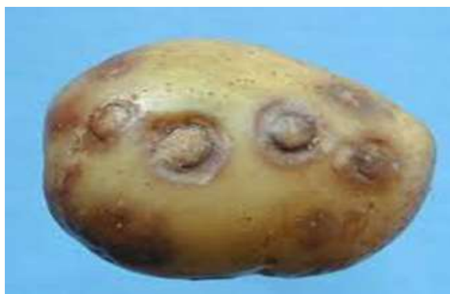
شکل ۳. علائم لکه حلقوی بافت مرده در غده‌های آلوده به PVY

۲) آلودگی ثانویه (سال دوم): بوته‌هایی که در سال اول به ویروس وای آلوده می‌شوند، غده‌هایی تولید می‌کنند که تعدادی از آنها آلوده به این ویروس می‌باشند (شکل ۳). کاشت این گونه غده‌ها، منجر به تولید بوته‌های دارای آلودگی ثانویه خواهد شد. در سال دوم بوته‌هایی که از