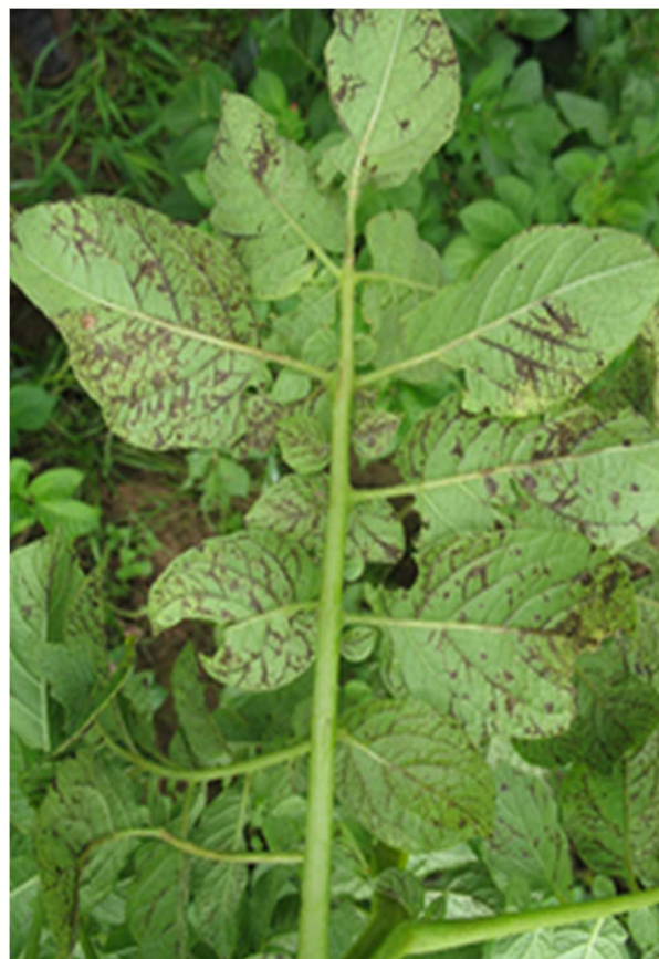
شکل ۲. علائم آلودگی اولیه در سیب‌زمینی مبتلا به ویروس وای نکروز شدن رگبرگ‌ها (راست) و آویزان شدن برگ خشک‌شده به ساقه (چپ)