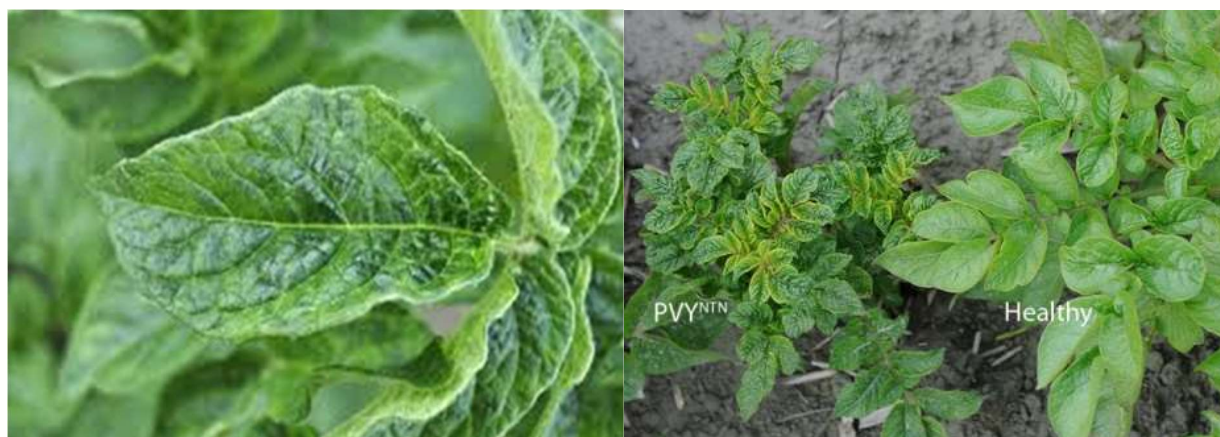
شکل ۴. علائم آلودگی ثانویه در بوته‌های سیب‌زمینی مبتلا به ویروس وای سیب‌زمینی.