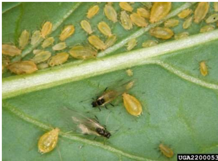
شکل ۶. شته سبز هلو ناقل اصلی ویروس وای سیب‌زمینی، شته بالغ بی‌بال، پوره سنین مختلف و شته بالغ بالدار