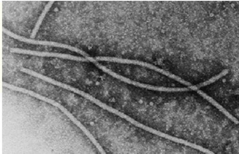
شکل ۵. پیکره میله‌ای و خمش پذیر ویروس وای سیب زمینی