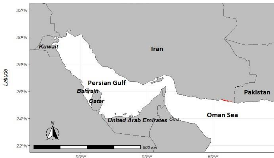
شکل ۱: موقعیت مناطق جمع آوری اطلاعات ماهی حلوا سیاه در ابهای جنوب کشور (خلیج فارس و دریای عمان) Figure 1: Location of data collection areas of Parastromateus niger in the (Persian Gulf and Oman Sea)

۴ برابر صید حداکثر به عنوان حداکثر ظرفیت حمل بعنوان ورودی مدل و C_y = صید در سری زمانی و سال y می‌باشد (Froese et al. , 2016). در این روش میزان مرگ و میر صیادی حداکثر محصول پایدار ۵ با کمک فرمول F_{msy} = r/2 و حداکثر محصول پایدار از فرمول MSY = rk/4 و زی توده حداکثر محصول پایدار ۶ B_{msy} = K/2 محاسبه می‌شود. وضعیت صیادی معمولاً براساس میزان شاخص زی توده موجود به زی توده حداکثر محصول پایدار (B/B_{MSY}) و همچنین میزان شاخص مرگ و میر صیادی موجود به مرگ و میر صیادی حداکثر محصول پایدار (F/F_{MSY}) ارزیابی می‌شود (Zhou et al. , 2017). به منظور آنالیزها و تجزیه و تحلیل‌های آماری از نرم افزارهای R studio (1.1.446) و SPSS (21) و سطح معنی داری ۰/۰۵ و حدود اطمینان ۹۵٪ استفاده شد.