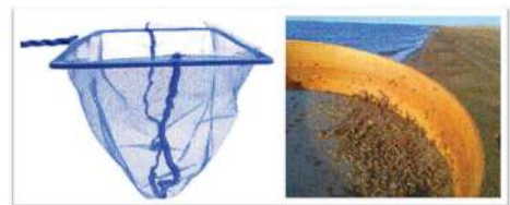
شکل ۶- ساچوک و الک با چشمه ۱ میلی متر برای صید آمفی پودا از محیط طبیعی.

آمفی پودا پرورش یافته بوسیله تور با اندازه چشمه متفاوت صید می‌گردند. بطوریکه افراد درشت‌تر برای استفاده به عنوان ایتم غذایی جدا و افراد کوچک‌تر به استخرهای پرورش برگردانده شده تا رشد نمایند. همچنین می‌توان آمفی پودا را از محیط طبیعی با استفاده از ساچوک با چشمه ۱ میلی متر صید نمود (Mathias et al., 1982).