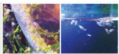
شکل ۵ - اکواریوم حاوی آمفی پودا در ستون آب و بستر.

فراهم نمودن شرایط محیطی تاریک برای پرورش آمفی پودا حیاتی بوده و درجه حرارت بهینه رشد ۳۱-۲۰ درجه سانتیگراد و pH در دامنه ۶/۸-۷/۵ برای پرورش آنها مناسب است. تعویض آب بصورت هفتگی انجام شده و ۳۰-۲۰٪ از آب تعویض می گردد (Hargeby and Petersen, 2006). معمولاً گاماروسها بیشتر در شبها نسبت به ساعات روز فعالند. آمفی پودا معمولاً نزدیک به بستر یا در میان اشیای زیر آب جایی که آنها بتوانند از دست شکارچینی چون ماهی مخفی بمانند زندگی می کنند.