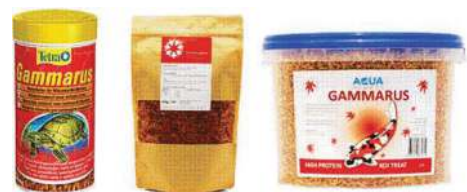
شکل ۷- آمفی پودا خشک شده در بسته بندی برای تغذیه آبزیان زینتی.

رژیم غذایی حاوی آمفی پودا اگر در مکان سرد و خشک و دور از نور قرار گیرد، بدون از دست دادن کیفیت، به آسانی قابل نگهداری بوده و قارچ‌ها نیز نمی‌توانند بر روی آن رشد کنند (Stickney and Kohler, 1990).