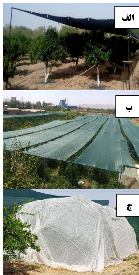
شکل ۱- روش‌های اجرای سایبان

بعضی از باغداران از پوشش‌ها برای پوشاندن کل باغ از جمله سطح خاک به‌صورت افقی در فاصله مشخصی بالاتر از درختان (شکل ۱-الف) استفاده می‌کنند (۷). برخی دیگر، فقط ردیف‌های بالای درختان را توسط پوشش‌ها پوشانده‌اند (شکل ۱-ب) و فواصل بین ردیف‌ها بدون پوشش می‌باشند (۱۸). در بسیاری از موارد تک‌درختان توسط پوشش، پوشیده می‌شوند و سایبان همانند چادر روی تاج درخت را می‌پوشاند (شکل ۱-ج) و سطح خاک پوشیده نمی‌شود (۲۹).