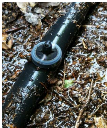
شکل ۳- خروج آب از قطره‌چکان‌های بین ردیف‌های بوته‌های چای و مرطوب شدن سطح خاک به صورت موضعی در زمان آبیاری قطره‌ای