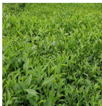
شکل ۴- رشد زیاد شاخساره‌های (عملکرد) چای در کرت‌های با آبیاری کامل و ۱۵۰ کیلوگرم کود نیتروژنی در سامانه‌ی کود آبیاری قطره‌ای (سمت راست) و خشک شدن شاخساره‌ها در کرت‌های بدون آبیاری (سمت چپ)