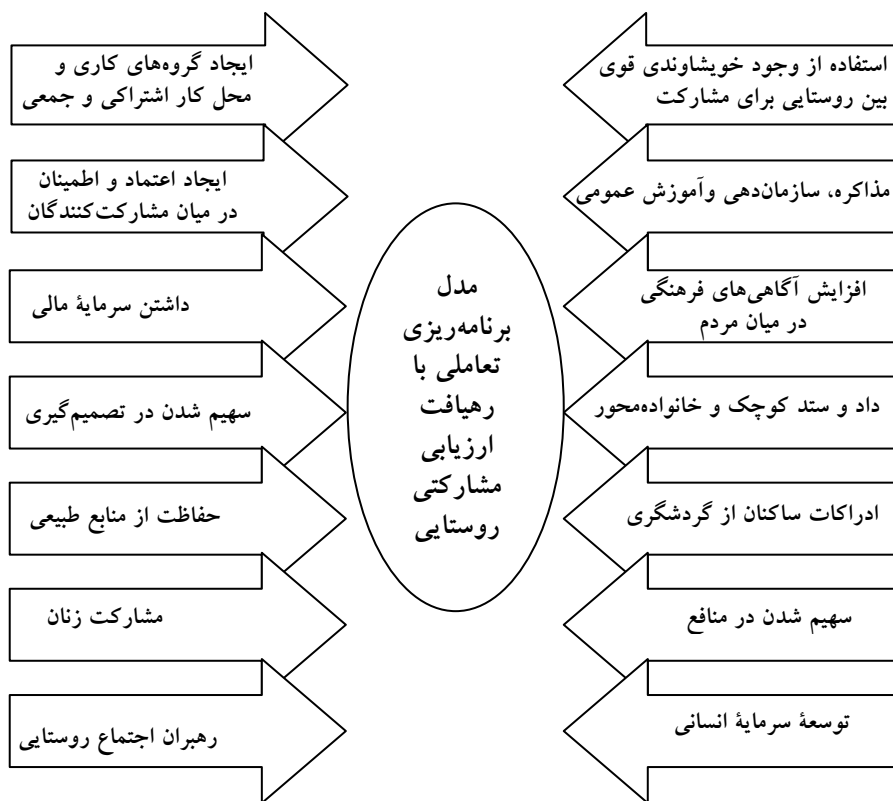
شکل ۲- مدل برنامه‌ریزی تعاملی با رهیافت ارزیابی مشارکتی روستایی

مرحله دوم: تثبیت گردشگری روستایی (سهیم شدن در منافع؛ سهیم شدن در تصمیم‌گیری؛ ایجاد اعتماد و اطمینان در میان مشارکت‌کنندگان؛ توسعه سرمایه انسانی «آموزش و پرورش، کسب مهارت، ایجاد آگاهی»؛ گسترش شبکه‌ها و ارتباطات اجتماعی؛ ایجاد گروه‌های کاری و محل کار اشتراکی و جمعی؛ حفاظت از منابع طبیعی). مرحله سوم: رکود گردشگری روستایی (مذاکره، سازمان‌دهی و آموزش عمومی).