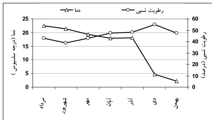
شکل ۱- تغییرات میانگین دما و رطوبت نسبی انبار نگهداری پیازهای سیر سفید همدان