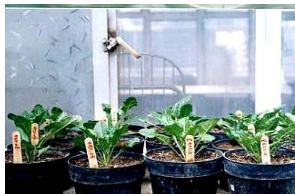
Fig. 5 Established sugar beet clones in greenhouse