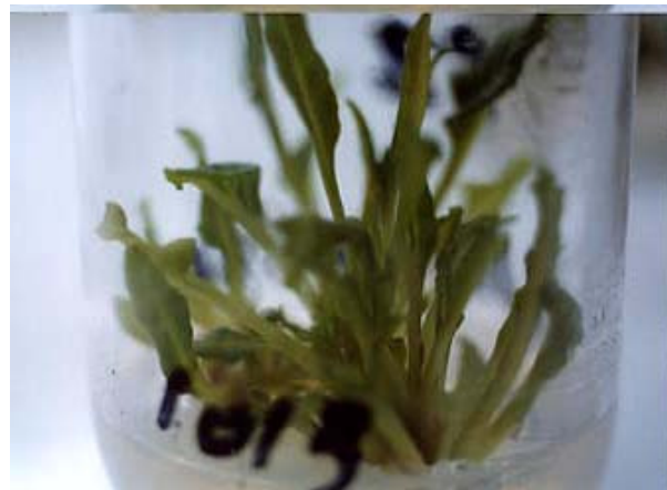
شکل ۱ ازدیاد ریز جوانه در محیط A

در اجرای این طرح، یافته‌های زیر برای نخستین بار در ایران به دست آمد: ۱) دستیابی به ترکیب هورمونی جدید برای ازدیاد درون شیشه‌ای چغندرقد، ۲) طراحی و ساخت دستگاه آب‌کشت و به کارگیری آن در برنامه ریزازدیاد کلونی گیاهان در ایران و ۳) فراهم نمودن پارامترهای فتواتوتروفیسم مؤثر در تطبیق‌پذیری ریز گیاهچه‌های چغندرقد.